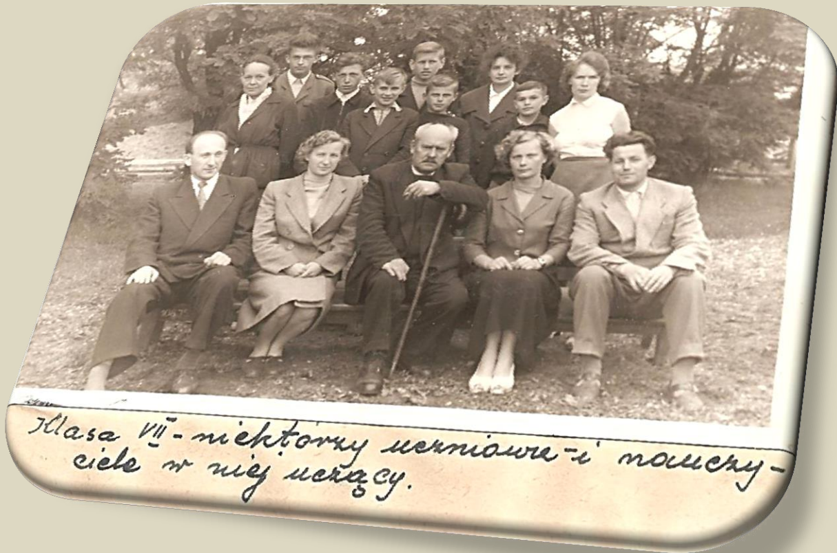
Класа VII - некторы учениове и момичу- цие в ней учящы.