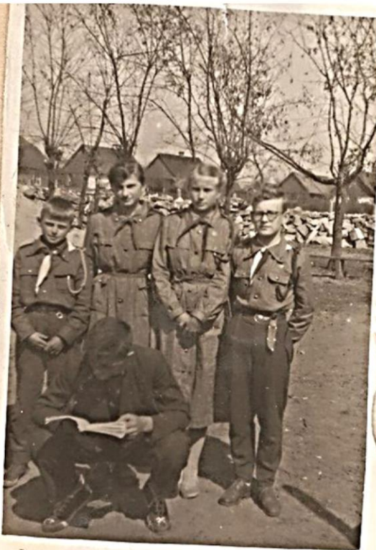
Harcerze przed zbiórka