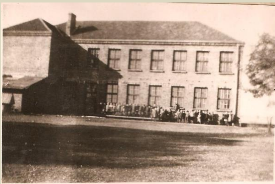
Budynek szkoły w 1947 r.