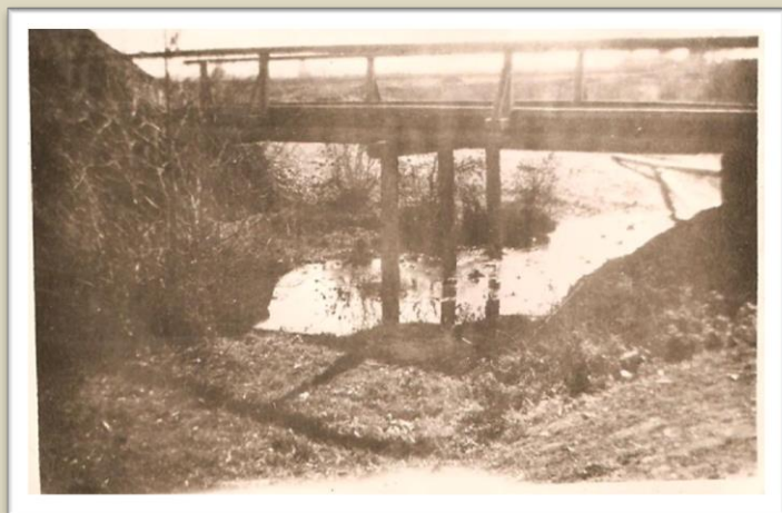
Nowy most (widok z przodu)

Między wsią Pięty, a szkołą przepływa rzeka Kamienna. Na rzece była kładka prowizorycznie przerzucona składająca się z 2 okrągłych kawałków drzewa. W porze zimowej