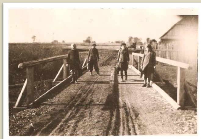
.. i nowy most