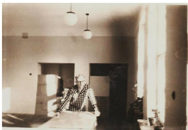
Ping-pong w świetlicy.