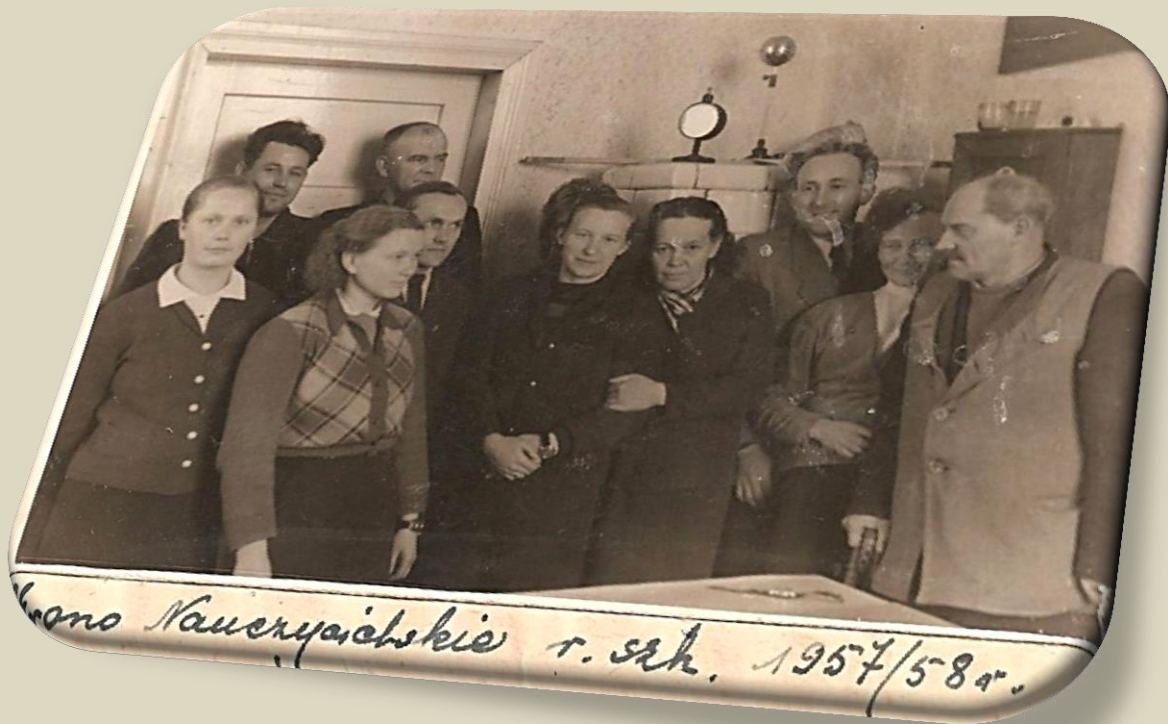
Класа Кавкыяцкіе т. shk. 1957/58г.