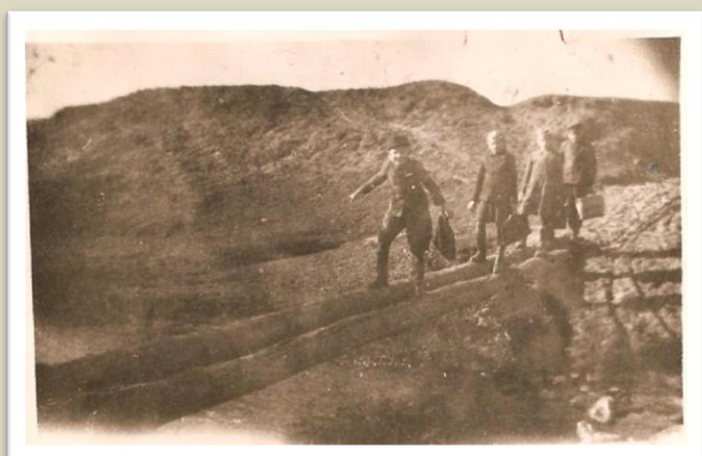
Prowizoryczna kładka na rzece Kamiennej

dzieci do pięciu klas. Uczniowie z klas VI i VII uczęszczali do szkoły w Bliżynie. Wybrany Komitet Rodzicielski przez cały miesiąc wrzesień czynił starania o przydział ławek. W efekcie tego szkoła dostała nowe ławki i od 1 października zostały przyjęte wszystkie dzieci od klasy I - VII.