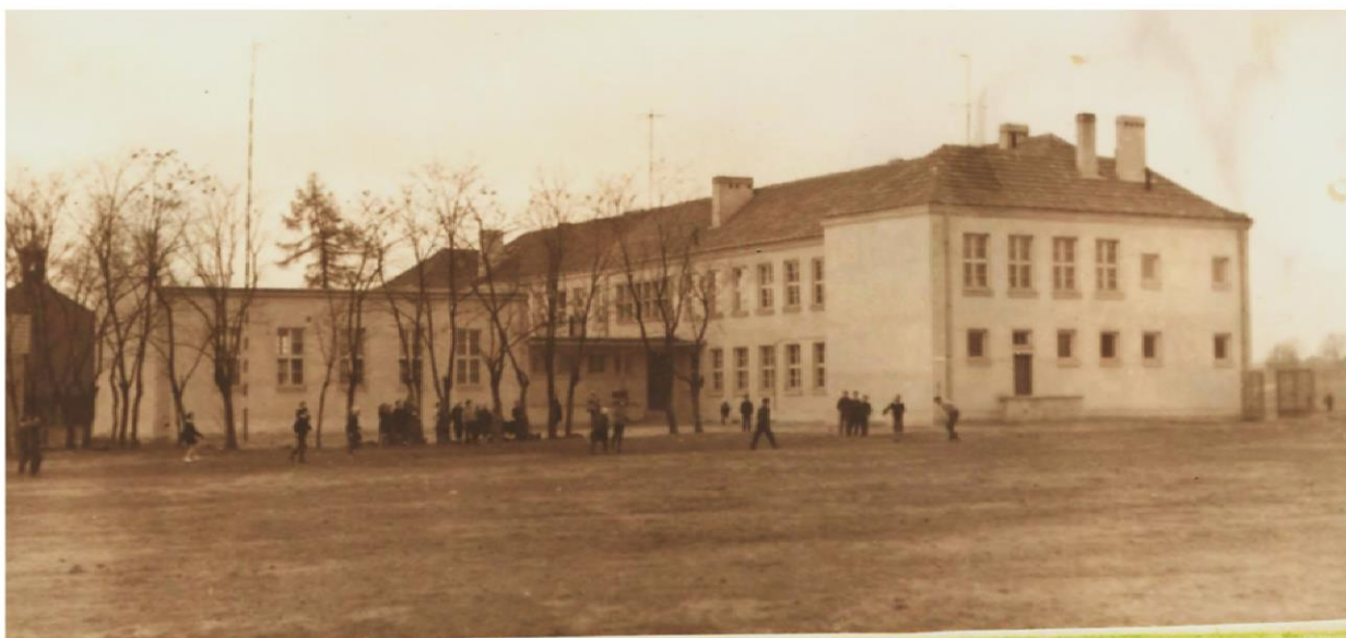
Chłopcy z S.K.S.-u na zajęciach. na boisku szkolnym.