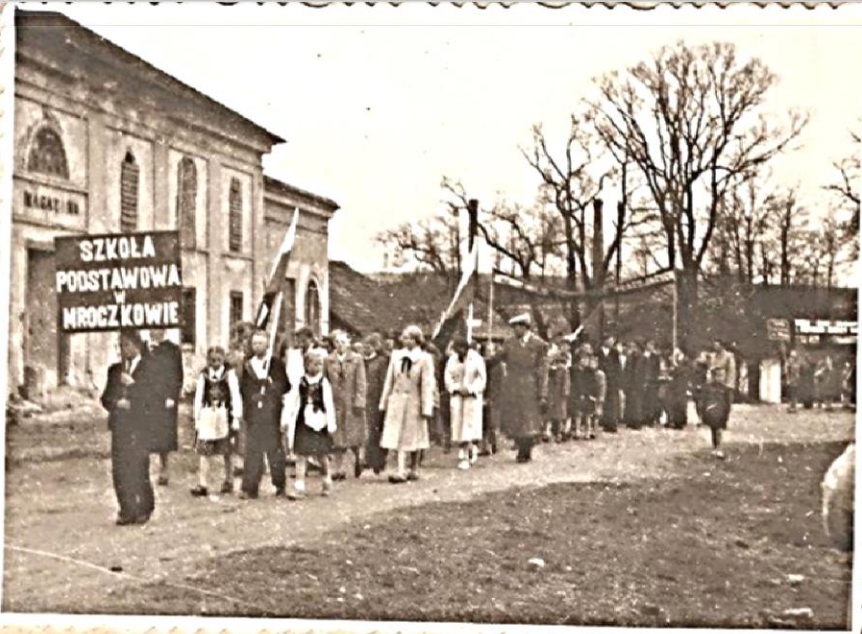
Na pochodzie 1-majowym w Blizynie