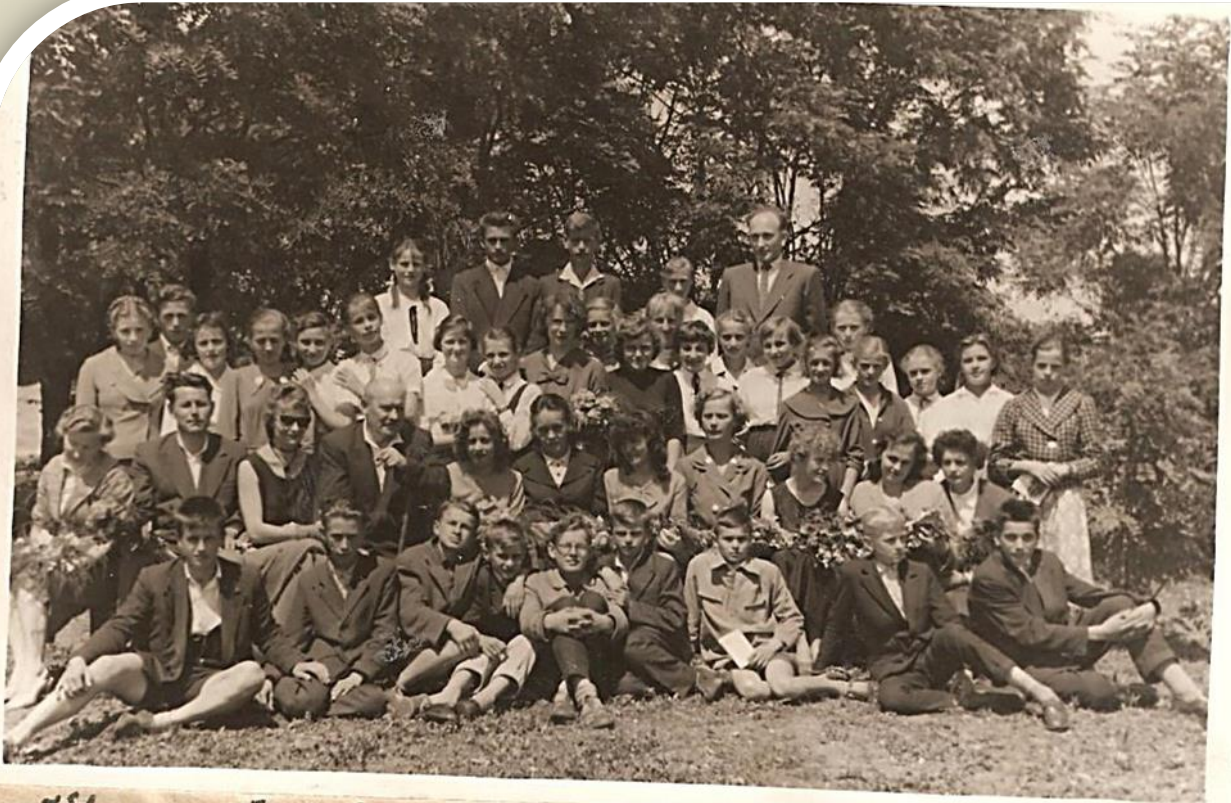
Klasa VII i Grupa Nauczycielskie r. szk. 1959/60